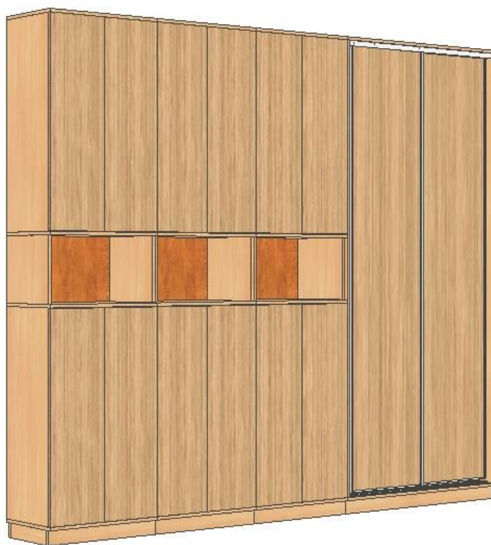
Poglądowy rys. zabudowy meblowej pok. 11.19 strona prawa