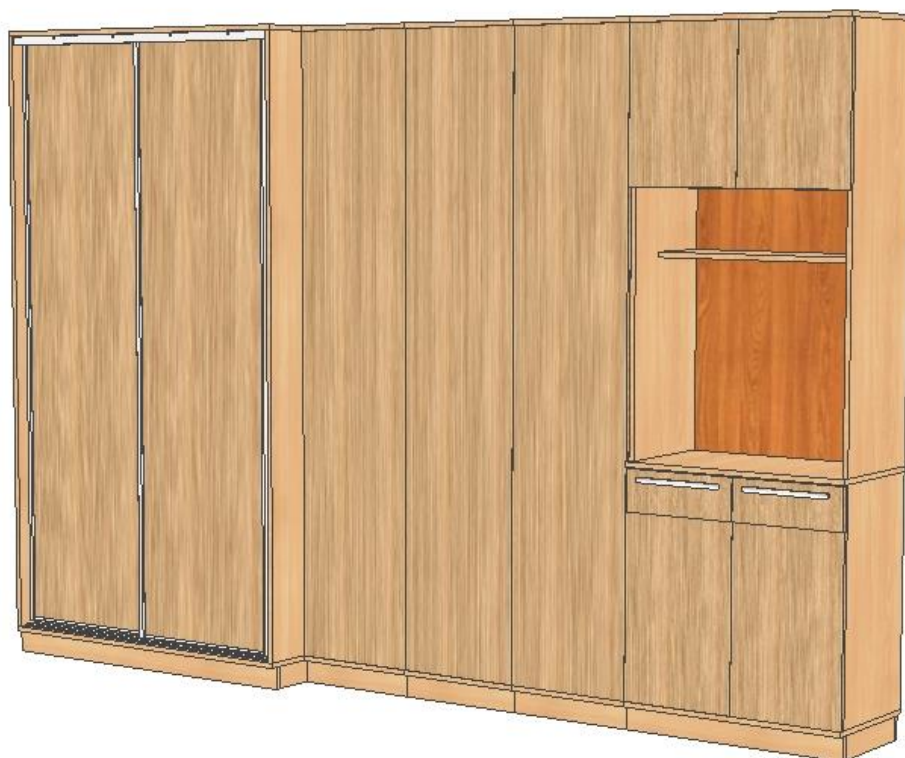
Poglądowy rys. zabudowy meblowej pok. 11.19 strona lewa