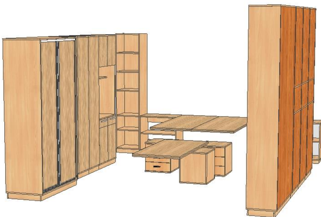
Poglądowy rys. zabudowy meblowej pok. 11 .19